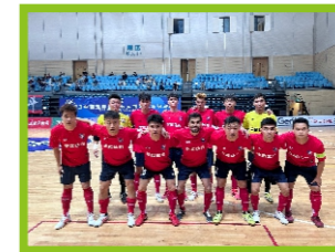
公平竞赛奖 湖北武汉地龙足球俱乐部