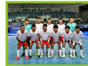
公平竞赛奖 肇庆市奥动体育足球俱乐部