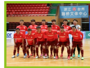
公平竞赛奖 台州和合足球俱乐部