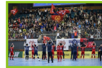
优秀赛区奖 河北石家庄赛区