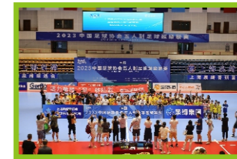
优秀赛区奖 上海嘉定赛区